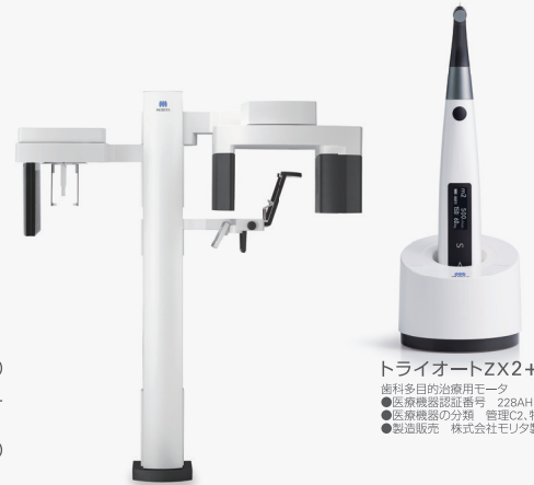
Veraview X800+ デジタル式歯科用X線撮影装置 ●医療機器認証番号 228ACBZ00008000 ●医療機器の分類 管理C2、特管 ●製造販売 株式会社モリタ製作所

ご入力いただいたお申し込み情報は、モリタ個人情報収集方針に準じ厳密に取り扱いたします。 https://japan.morita.com/privacy/index.html 友の会セミナー開催に関する注意事項は www.dental-plaza.com/rule/semi.html に掲載しております。